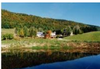
Centre de Montagne