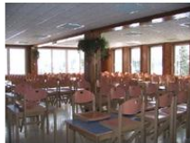
Salle de restaurant

Salle polyvalente / Salle de jeux 1 salle polyvalente de 100 places permettant la pratique du ping-pong, baby-foot mais également l'organisation de conférences (avec grand écran, rétro et vidéo projecteur, éclairage scénique), séances de cinéma, de spectacles de chants et de musique.